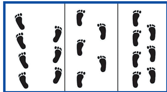
特発性正常圧水頭症 健常者 パーキンソン病